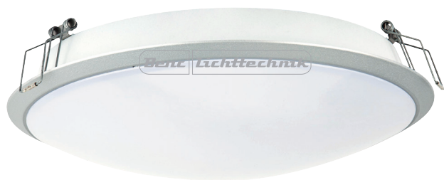
14 W/830, 1300 lm netto