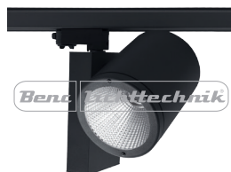
MAKON 17 W/940, 2000 lm