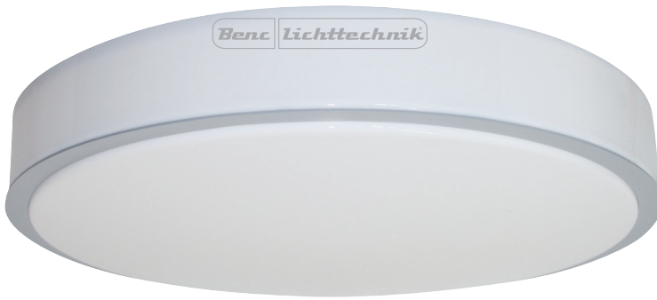
45 W/830, 4600 lm netto