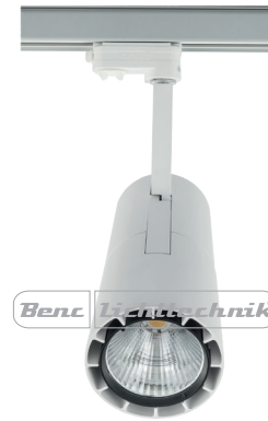
28 W/927, 2000 lm brutto