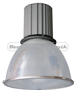
39 W/840, 3000 lm netto